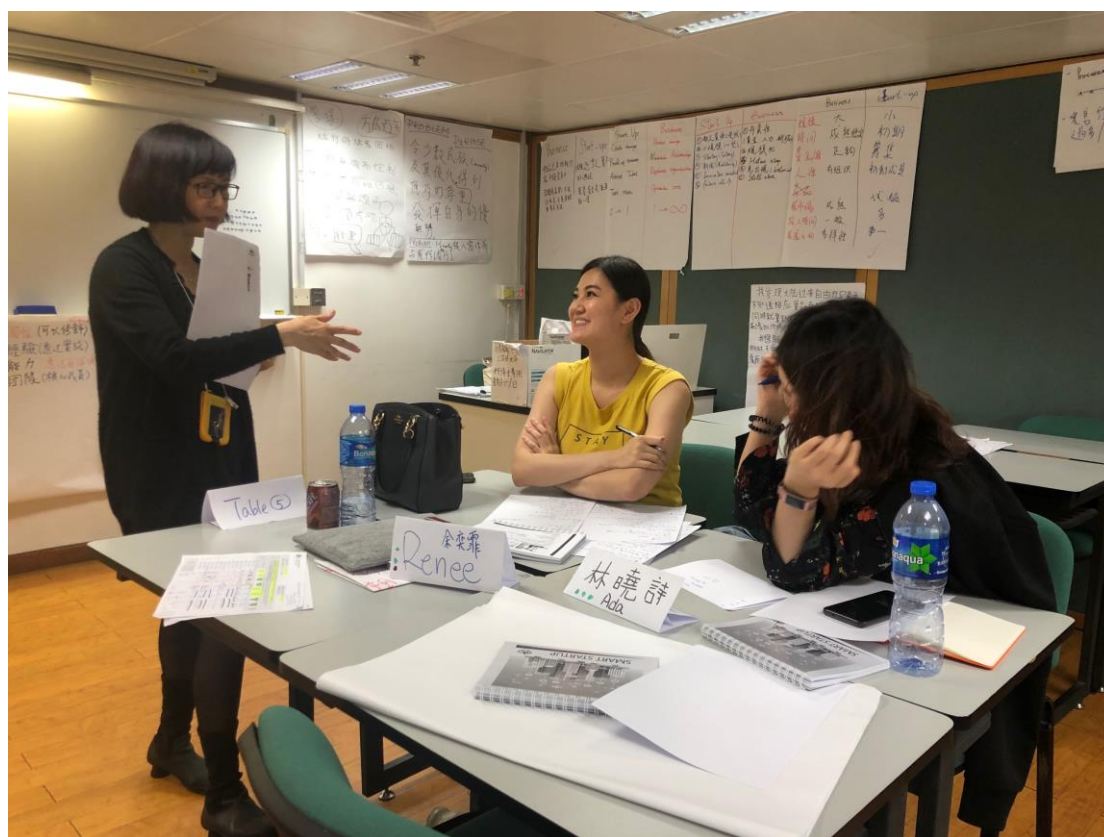
圖：導師與學員交換意見。