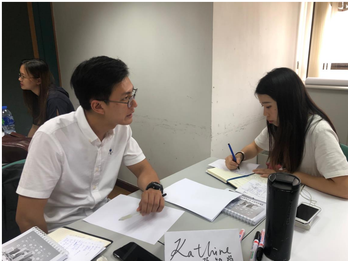
圖：學員模擬與客戶對話，找出是否潛在對象。