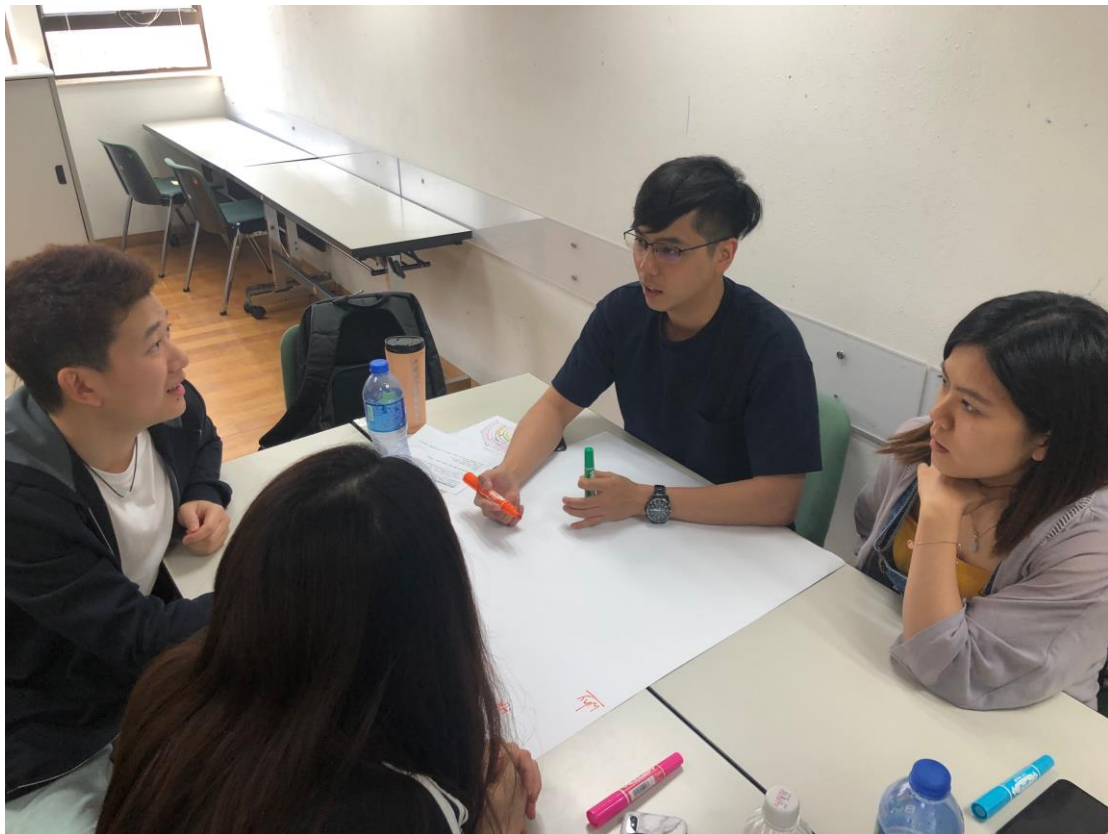
圖：學員互相討論路演題目方向。