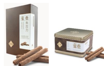
朱古力蛋卷 (10 件裝、英記罐裝)