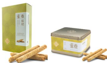
榴槤蛋卷 (10 件裝、英記罐裝)