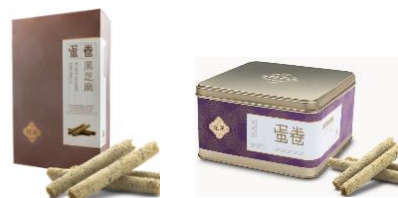
黑芝麻蛋卷 (10 件裝、英記罐裝)