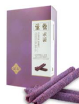
紫薯蛋卷 (10 件裝)