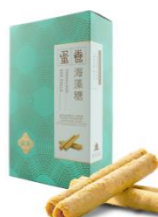
海藻糖蛋卷 (10 件裝)