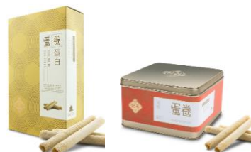
蛋白蛋卷 (10 件裝、英記罐裝)