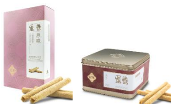
原味蛋卷 (10 件裝、英記罐裝)