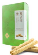
香蔥蛋卷 (10 件裝)