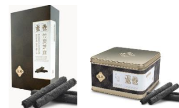
竹炭芝麻蛋卷 (10 件裝、英記罐裝)