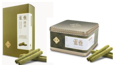
綠茶蛋卷 (10 件裝、英記罐裝)