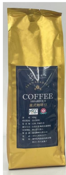
薈真集義式咖啡豆