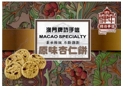
牌坊手信原味杏仁餅