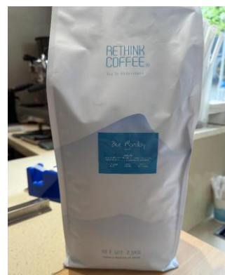
RETHINK COFFEE Blue Monday 咖啡豆