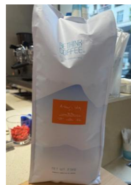
RETHINK COFFEE Arthur's Way 咖啡豆