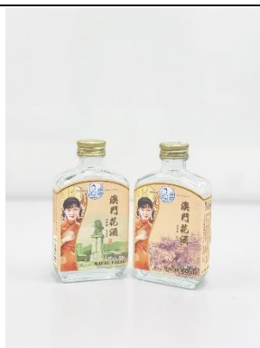
澳門小花酒 100ml 50%vol