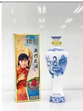
青花 53 度高粱酒 500 ml