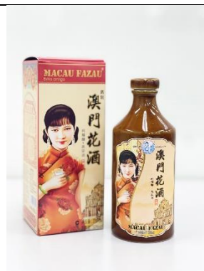
舊裝 50 度高粱酒 330 ml