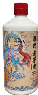
澳門老茅香醬香型白酒系列