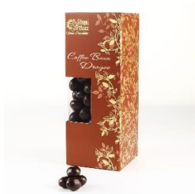
Schoggi Meier 咖啡豆黑朱古力