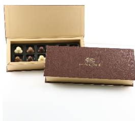
Schoggi Meier 雜錦四兄弟朱古力